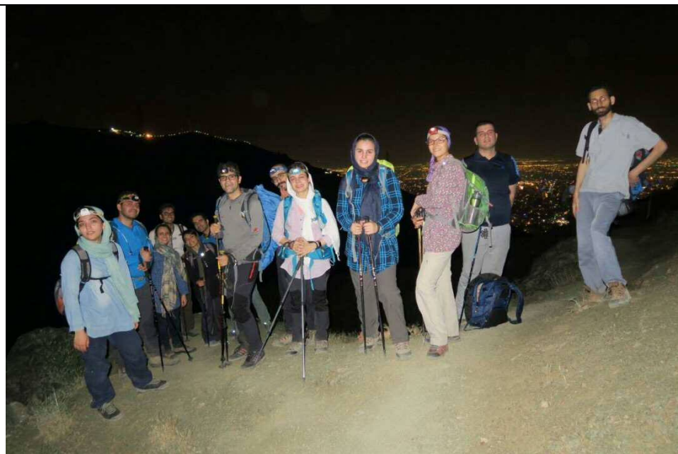
عکس ۳: در راه پناهگاه، عکاس: سبحان علیپور